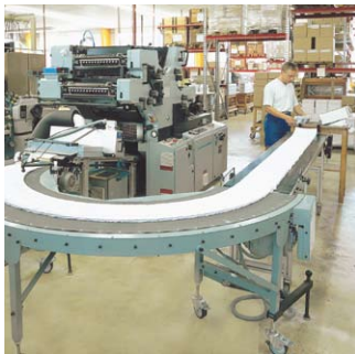
Eine unserer Spezialitäten: die B1-Couvertdruckmaschine .