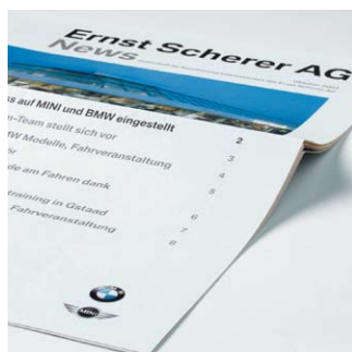
Auch Zeitungsbeilagen gehören zu unserem vielfältigen Angebot.