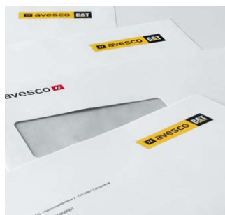
Edel, diskret oder ganz modern: Briefschaften für geschäftliche und private Zwecke.