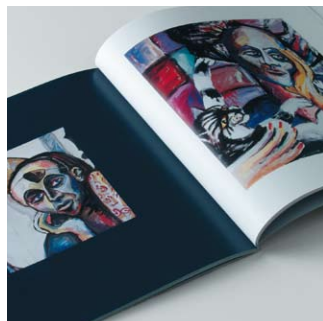
Ausgefallen oder klassisch: Image- und Produktbroschüren für Unternehmen in verschiedensten Branchen.