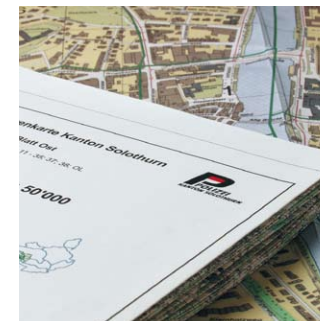
Wo kämen wir hin ohne Landkarten und Stadtpläne... ?