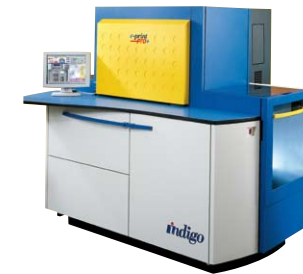
Die moderne Digitaldruck-einrichtung Indigo erfüllt Wünsche.