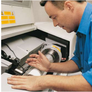
Der Trommelscanner digitalisiert alle Vorlagen in höchster Qualität.