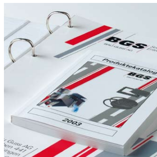
Blocks, Garnituren, Ringbücher, Endlosformulare: alles für den Bürobedarf .